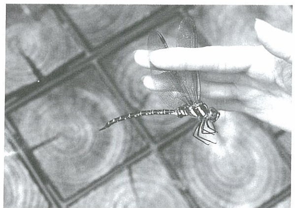
オオルリボシヤンマ