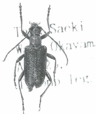
クビアカナカミキリ