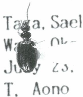
クロツブゴミムシ