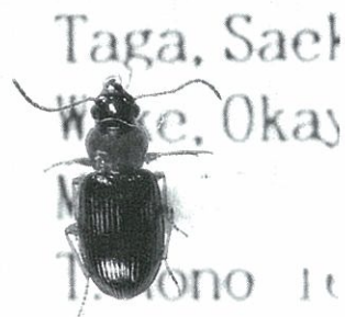
アカクビヒメゴモクムシ