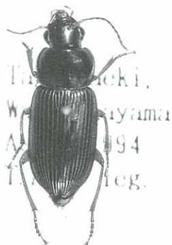
タナカツヤバネゴミムシ