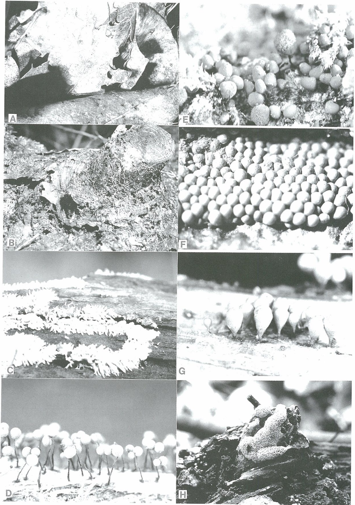
図 2 - 1 .