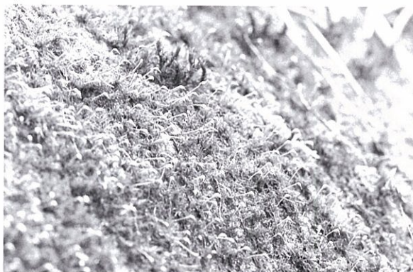
写真2. チジミバコブゴケ