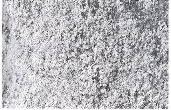
写真3. ホソバオキナゴケ

Iwatsuki, Z., 1991. Catalog of the Mosses of Japan, 182pp. Hattori Botanical Laboratory, Nichinan.