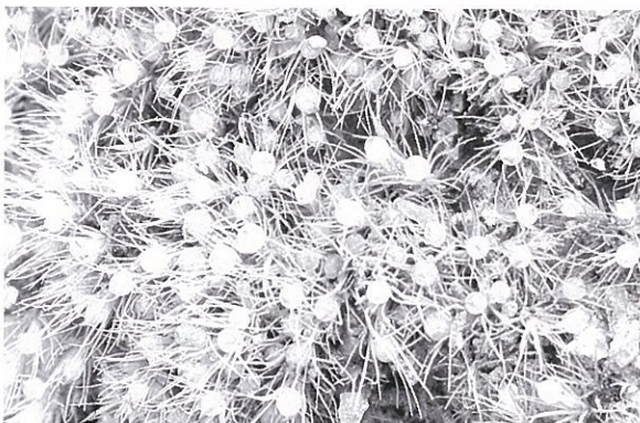
写真1. ホソバノキンチャクゴケ