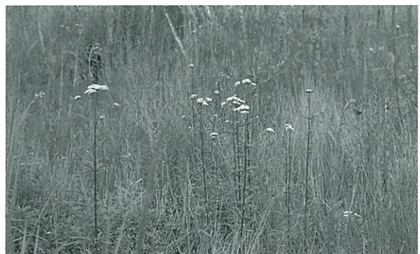
写真4. 3年目の湿原内部の状況.