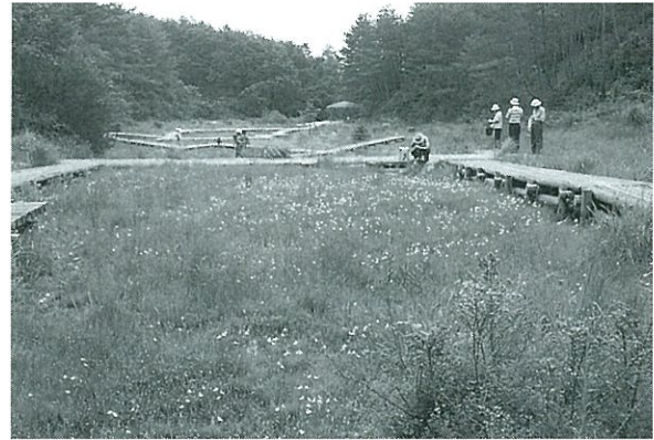
写真1. 3年目の湿原の上部の状況.