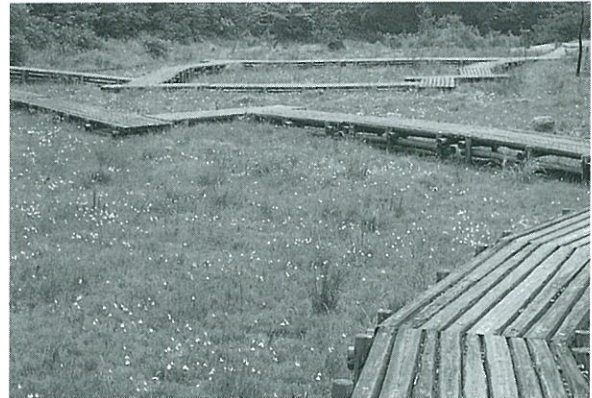
写真2. 3年目の湿原の中部の状況.