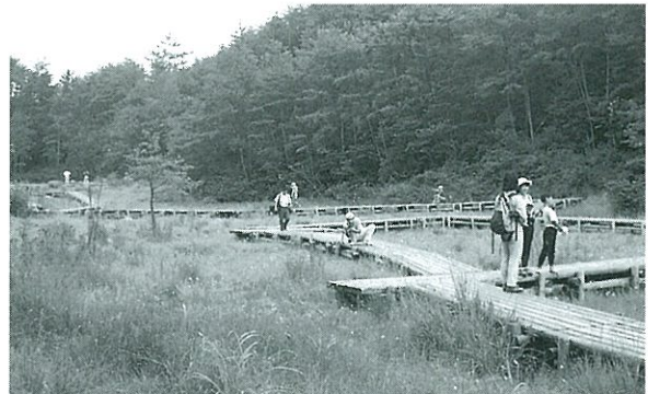
写真3. 3年目の湿原の下部の状況.