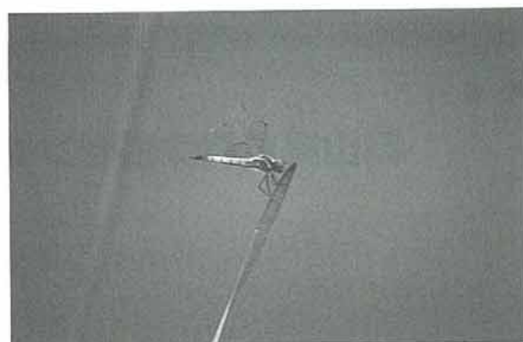
写真1. コフキトンボ