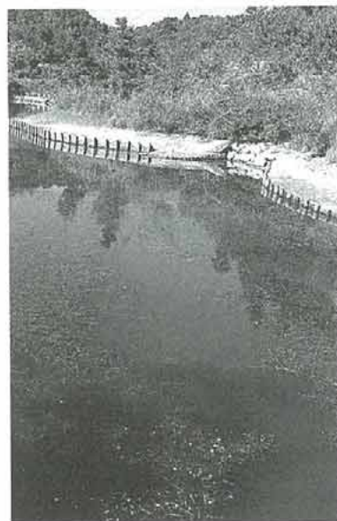
写真3. 田尻大池北岸 (1998. 9. 19). 虫の原っぱからの流入口. クロモが今までにないくらい繁茂した. 周辺の石垣にハグロトンボのオスが止まっているのが1997年以降観察されるようになった.