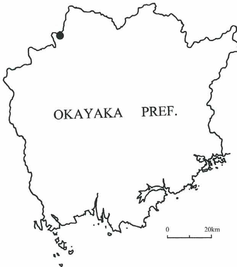
図1. 岡山県真庭郡新庄村土用ダム地区の位置（黒丸）。