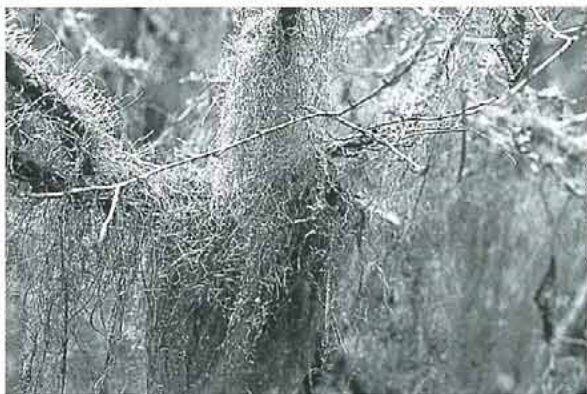
写真3. 枝から密に垂れ下がる懸垂性蘚類