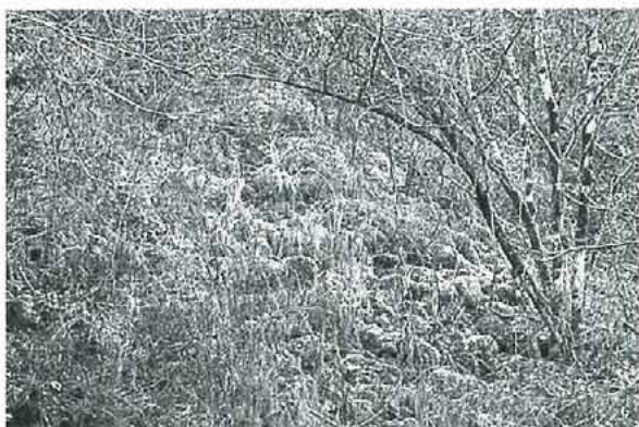
写真2. 権現谷の川原斜面