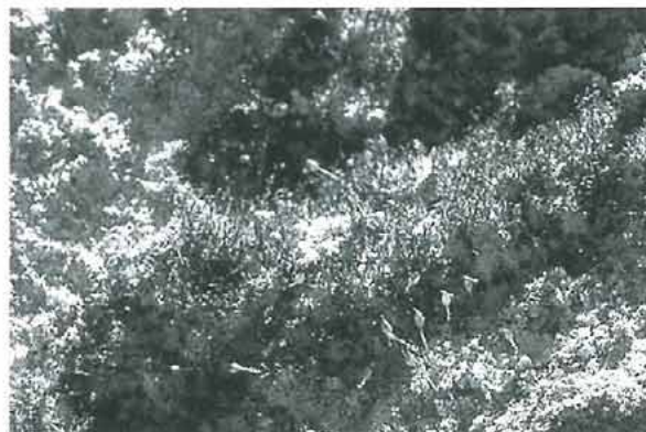
写真6. 石灰岩壁上の微小なキヌシッポゴケ属