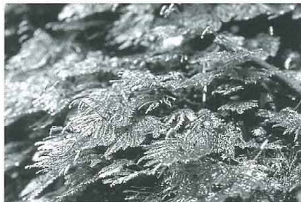
写真8. 石灰岩上のヒメクジャクゴケ