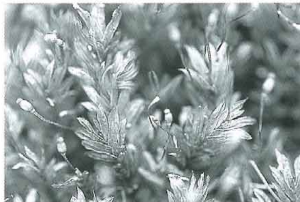
写真7. 胞子体を付けたホウオウゴケ属の種