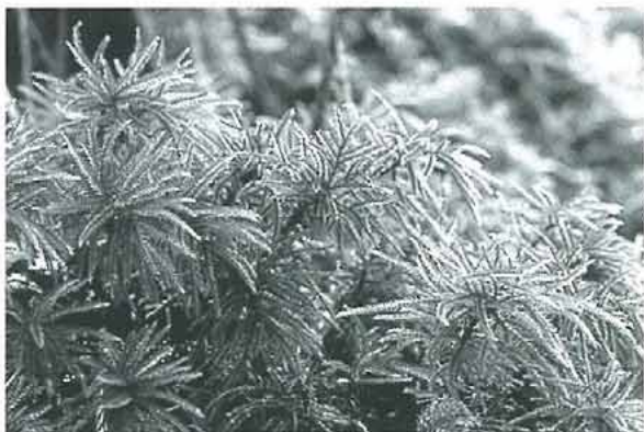
写真4. コウヤノマンネングサ