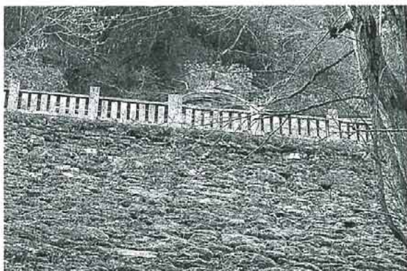
写真1. 穴門山神社の石垣