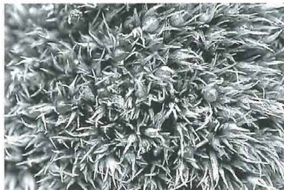
写真5. ツチノウエノタマゴケ