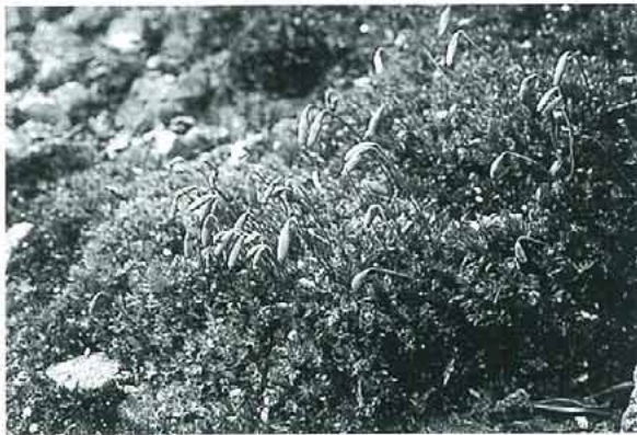
写真8. Bryum capillare ハリガネゴケ。 岩上, 石垣上などに生え, 茎は2.5cmほど, 葉は乾くと強くねじれ茎に接する。よく蒴をつける。