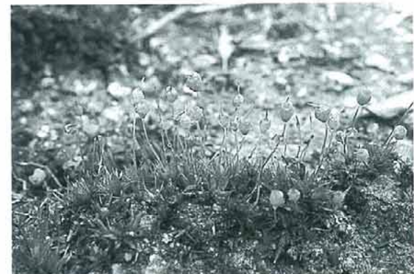
写真6. Physcomitrium eurystomum ヒロクチゴケ。 庭土, 畑土, また鉢木鉢の中などにもよく生える。茎はほとんどなく高さ約3mm。基部がふくれたカップ状の蒴をよくつける。蒴の形が大きく口を広げたように見える。