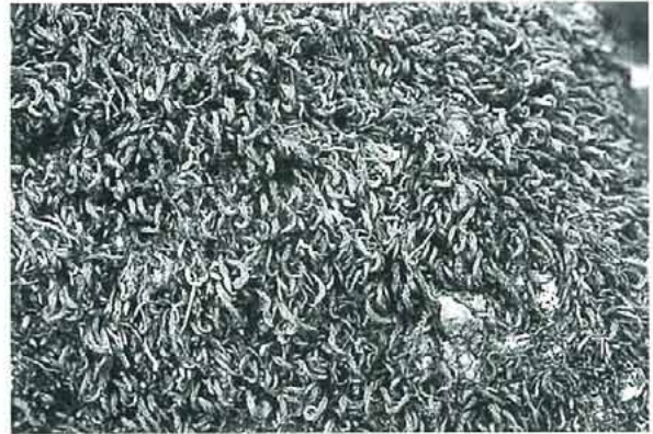
写真9. Herpetineuron toccoae ラセンゴケ。 山地の岩上や樹幹に群生する。茎は1~4cm。葉は乾くと茎に接し, 茎全体が犬の尾のように曲がる。日当たりの良いところでは褐色がかつた色になる。