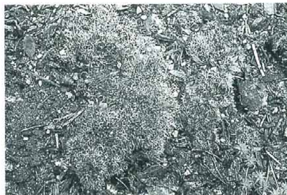
写真3. Weissia exserta トジクチゴケ。 陽地の土上, 石垣などに生育し, ツチノウエノタマゴケと同じ様な場所に見られるが, トジクチゴケは蒴が雌苞葉から出ることで見分ける。