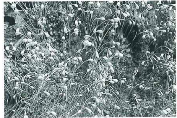
写真5. Fumaria hygrometrica ヒョウタンゴケ。 土上, 特に裸地になったところや焼き火跡などによく生える。茎は高さ1cm以下と小さく, ヒョウタン型の蒴をよくつけ, 分布域は広い。