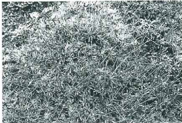
写真2. Atrichum undulatum ナミガタタチゴケ。 半陰地の土上, 岩上に群生する。茎は長さ4cmほどで, 葉は乾くと強く巻縮する。よく蒴をつける。