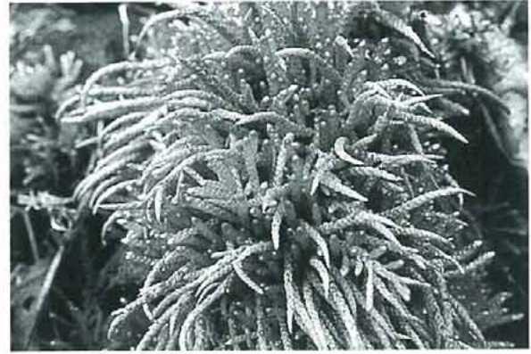
写真10. Myuroclada maximowiczii ネズミノオゴケ。 山地の岩上, 腐植土上, 木の根元などに群生する。横にはう茎から不規則に枝を出し, 長さ2~4cm。葉は重なり合って密につき, 茎の先で細くなった姿が, ネズミの尾のように見える。