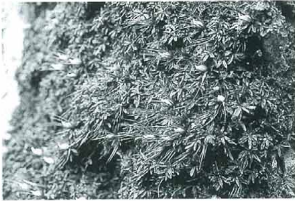
写真1. Diphyscium fulvifolium イクビゴケ。 林下の半陰地の土上, 岩上, また林縁の崖地に多く見られる。茎はほとんどなく, 麦粒をまいたように見える蒴は特徴的で, 蒴があればよく目に付く。