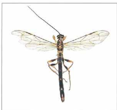
写真4. オオホシオナガバチ