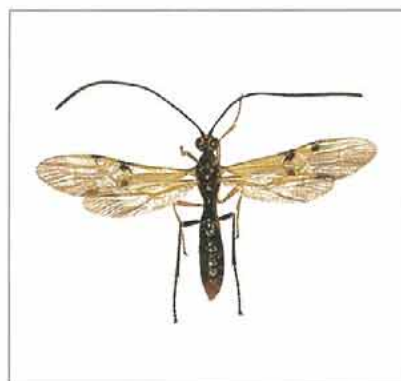
写真6. ウマノオバチ