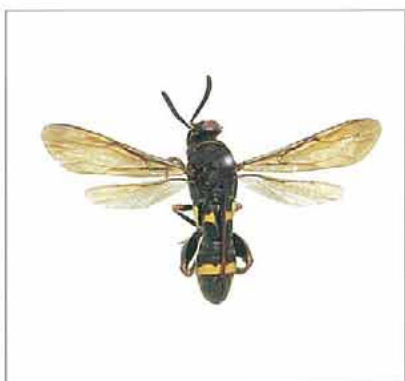
写真7. シリアゲコバチ