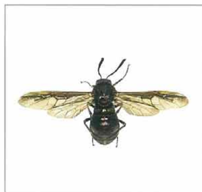
写真3. アカガネコンボウハバチ