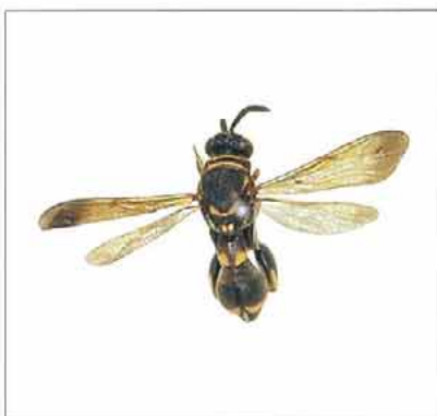
写真8. オキナワシリアゲコバチ