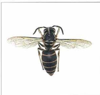
写真11. シダクロスズメバチ