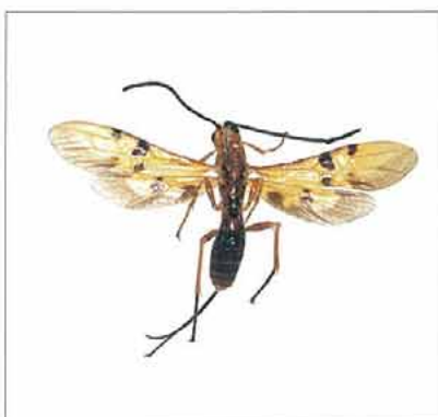
写真5. ヒメウマノオバチ