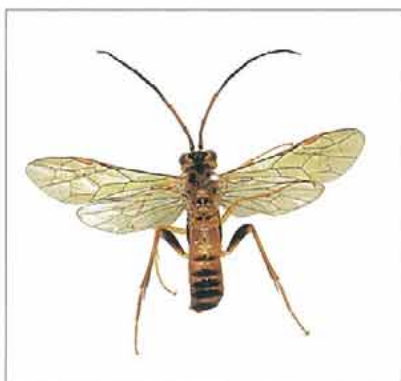
写真2. ヒゲナガハバチ