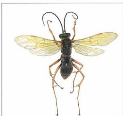
写真10. キバネトゲアシベッコウ