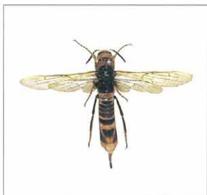
写真1. ヒラアシキバチ