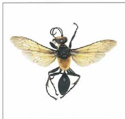
写真9. キンモウアナバチ