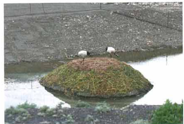
写真7. ケージ下の池の小島 (2007.4.11)

11月上旬、朝ケージから出すと、すぐに4羽根は揃って飛翔する。多くの場合、4羽根は中州上空を、山の中腹くらいの高度で数周旋回し、10分程度で中州や竹藪前広場に降りるが、風がない快晴の時や風の強い時などは、ビデオカメラでも捉えきれないほど上昇し、30分以上も飛び続けることもある。ただ、いずれの場合も南北は高梁川の川幅、東西は下倉橋から槻大橋の間の範囲から、大きく逸脱する事はなかった。