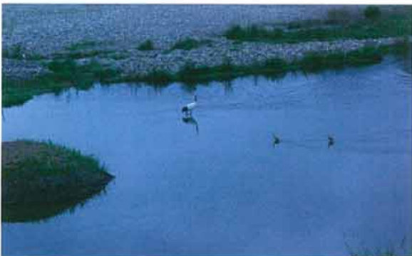
写真10. ヒナを置き移動するタケ (2007.6.20)