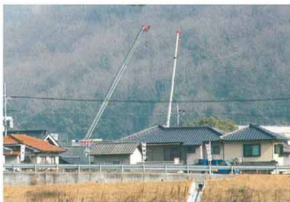
写真20. 稼動するクレーン (2008.5.15)

タケの切羽以後、これ以外にもう一度、見学者がいなくなると山側へ向かうことがあった。この時も研究員の誘導で中州に戻る事が出来た。両事例とも切羽後の数日後に連続して山に向かったことから切羽の影響によるものと考えられる。両事例とも研究員が近くにいる、人が立ち去ることで対処出来ているが、人が多くいた場合や研究員が作業等で現場にいなかった場合、そのまま山に逃げ込む事も考えられる。ショウと比較するとタケの場合、影響が少ないように見えるが、あくまで比較した場合であって、影響がなかったと言うことを示唆はしない。事実、親子の別れの過程においては、18年度と19年度においては、明瞭な差が出ている。