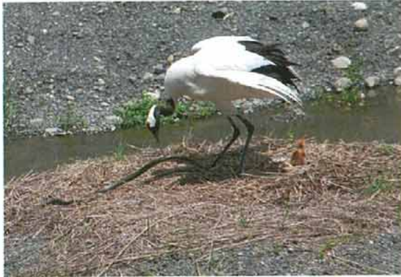
写真22. ヒナをシマヘビから守るタケ (2007.5.31)