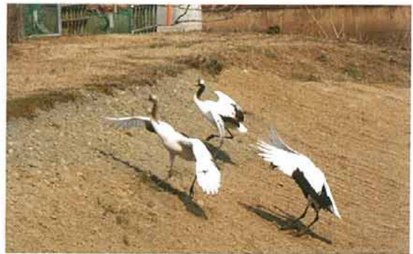
写真17. ヒナを威嚇するショウ (右) (2008.2.19)