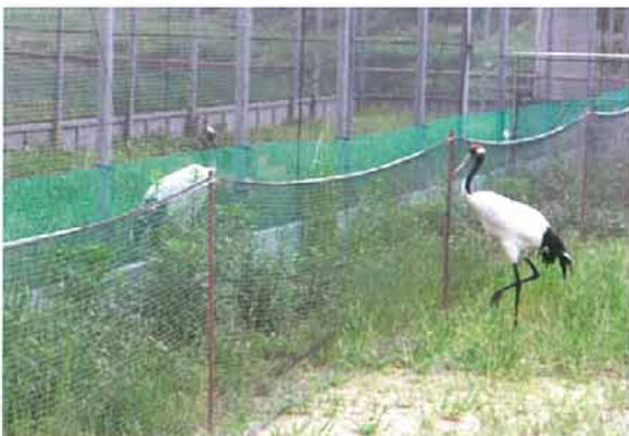
写真3. ケージ周りに張ったネットと威嚇をするタケ(右)と亜成鳥(2007.5.6)