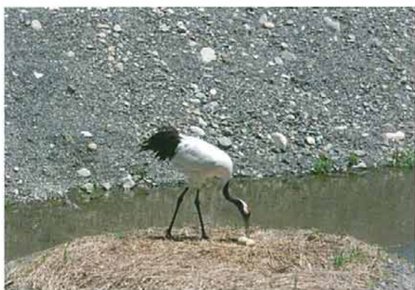
写真21. 巣に戻るタケ (2008.5.15)