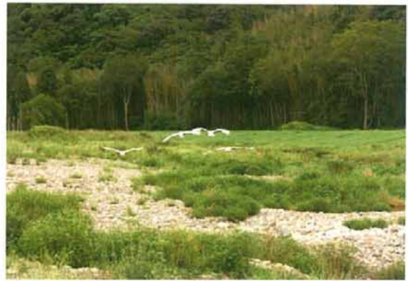
写真13. 親子4羽での飛行 (2007.9.1)