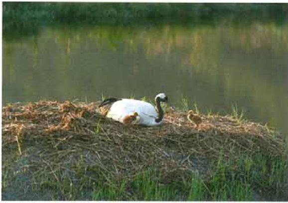
写真9. 孵化直後のヒナ (2007.6.2)