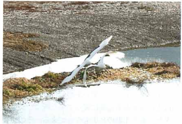
写真16. ヒナの尾羽を咬むショウ (右) (2008.2.17)