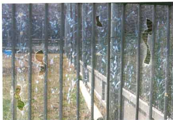
写真4. 破損したアクリル板 (2007.5.5)

平成20年1月、親鳥が時折求愛ダンスをするようになってからは一度も亜成鳥を攻撃する姿は見