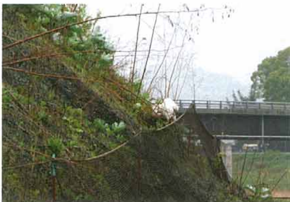
写真5. 逃げる亜成鳥 (2007.4.15)

ヒナ2羽に対して、亜成鳥が攻撃したり、逆にヒナが亜成鳥に攻撃したりするところは、まだ確認されてない。ただ、お互いに興味があるのか、