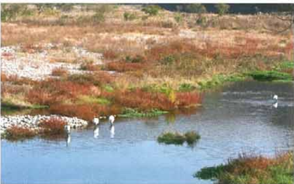
写真11. 親から離れるヒナD (右) (2007.8.16)