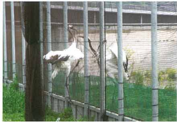
写真6. ケージ越しのタケ (右) と亜成鳥 (2007.4.24)