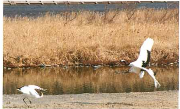
写真18. 飛翔して来てヒナに攻撃を加えるショウ (右) (2008.2.19)