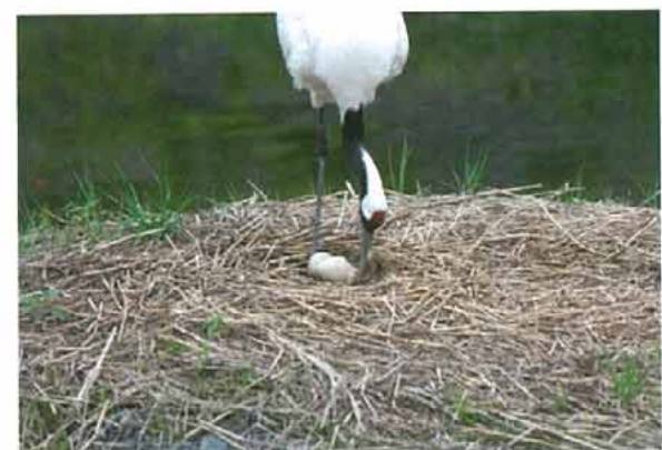
写真8. 第一卵目のヒナ (2007.5.31)