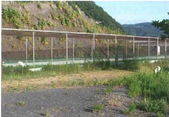
写真2. ケージ周りに張ったネット(2007.5.5)