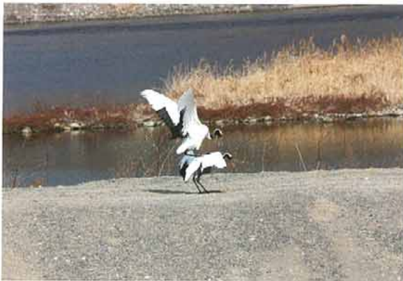
写真14. 交尾をするショウ・タケ (2008.2.10)

2006年度はタケによる威嚇が主であり、ショウによる子への威嚇は親子の別れに伴うものなのか、外敵としてのものなのか、はっきりしないものであったが、2007年度は羽の揃ったショウによる威嚇が多くなる。また、2006年度はヒナへの威嚇は3月17日からであるため、2007年度は1ヶ月半以上早く起こった事になる。これは、雄の切羽が親子の別れにまでも大きく影響することが推測される。また、2年とも雌から威嚇が開始されていることから、子別れの開始は雌から始まるのではないかとも考えられるが、この事例のみでの結論は早急すぎるため、今後の調査データの蓄積が必要である。