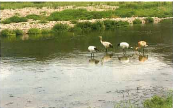
写真12. 親子での採餌 (2007.9.1)