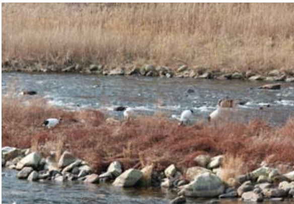
写真13. 川上町吉木成羽川, 中州の4羽 (2009.2.2)