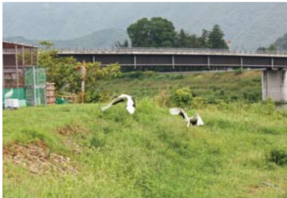
写真1. タカに追われるアン・ピー (2008.8.24)

これまでの観察で、カワ・ハシがアン・ピーに接近していく場面が観察される。これは、カワ・ハシは幼いためか、なわばり意識もあまり無く、他個体への排除意識よりも興味の方が強いため、アン・ピーへの自らの接近が見られ、接近後も協調が取れている理由と考えられる。