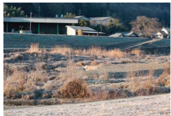
写真11. 木之子町薬師橋上流の小田川内のタカ (2009.1.25)