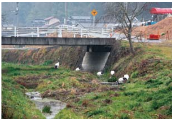
写真7. 槻谷川で過ごす6羽 (2009.1.18)