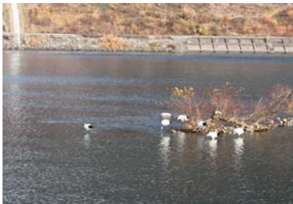
写真9. 中州A上流で採餌する6羽 (2009.1.15)

これ以降、1月24日~25日、2月2日~3日、2月7日~9日と、調査地外への飛行が続く。また、愛知県豊橋市で鳥インフルエンザが発生したため、野外での集団がどのように変遷していくのかは観察不可能となった。ただ、ケージ内においては大きな争いはなく、夜は池に集まり集団で過ごしていた。