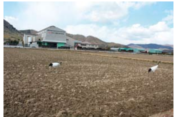
写真10. 矢掛町のタカ・アカ (2009.1.24)