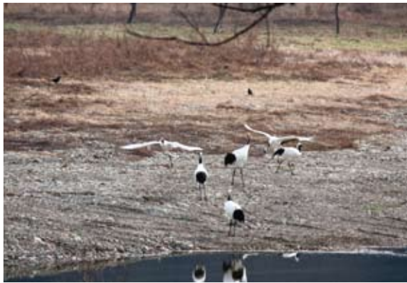
写真5. 下池でのタカによるアン・ピーへの威嚇 (2008.1.12)