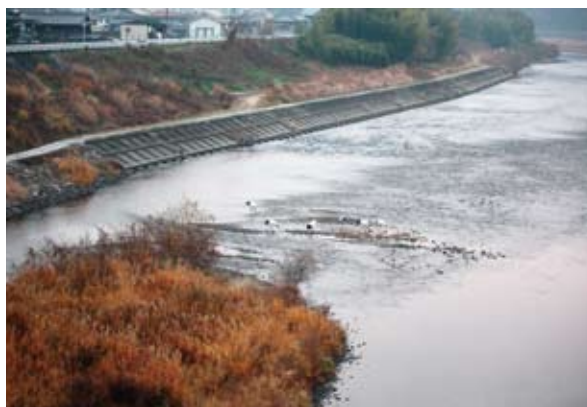
写真3. 槻大橋下の中州で夜間を過ごした翌日の6羽 (2008.12.15)

調査を開始し、徐々にではあるが6羽の夜間の集合がみられようになって来た。その要因は、調査地内へイノシシの出没が頻繁になり、警戒を行うと共に、気温も下がり始めたことが夜間の集合につながったものと推測される。また、アン・ピーの環境への適応が進んだことも要因の一つではないかと考えられる。