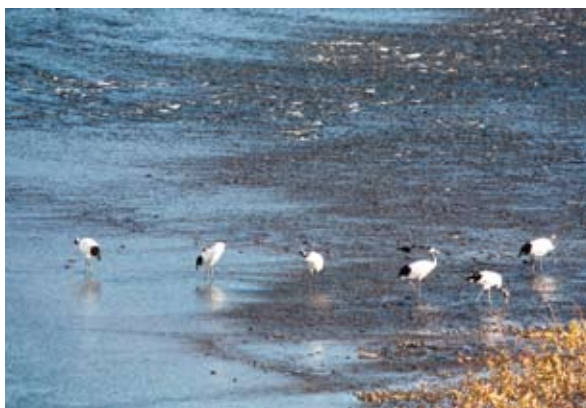
写真6. 槻大橋下の中州で過ごす6羽 (2009.1.18)