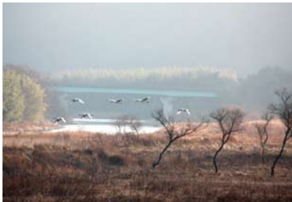
写真4. 6羽での飛翔 (2009.1.15)

アン・ピーの上記行動から推測されることは、以前に追われて逃げた時と、風に乗り6羽で豪溪付近まで行った時以外は、昭和小学校を越えて飛翔したことが無いため、警戒心も働き、4羽と離れたものと考えられる。