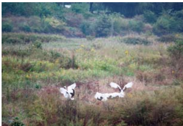
写真2. 中州にてタカに追われるアン・ピー (2008.10.26)