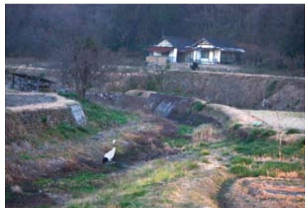
写真14. 北房町宮地川のアン（2009.2.7）