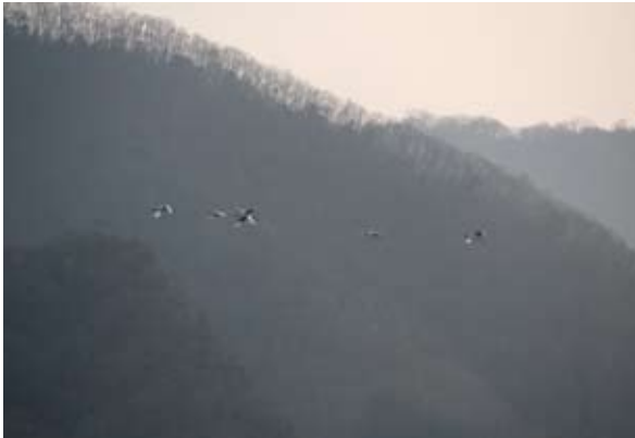
写真12. 高度を上げていく6羽 (2009.2.2)

をかけると早足で近づいて来る。捕獲ケージへの誘導を行う。タカは中程まで入るが、アカが警戒して入り口前後から中へ入ろうとしない。しかし、タカが中程で食べ続けているので、アカも頭上を気にしながらも徐々に中へ入り始める。2羽とも捕獲ケージの中程まで入ったので、ネットを閉め捕獲。閉める際も怯えることなく採餌していた。