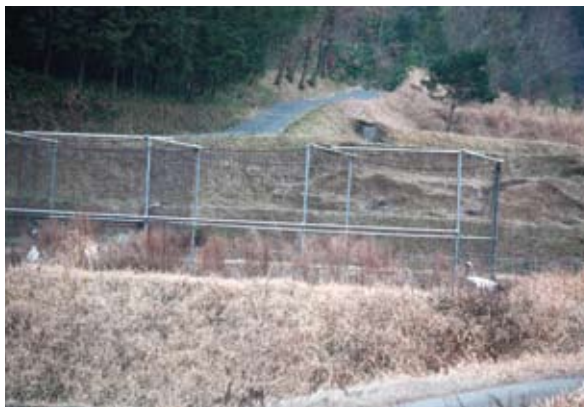
写真15. カワ・ハシに近づくアン (2009.2.9)