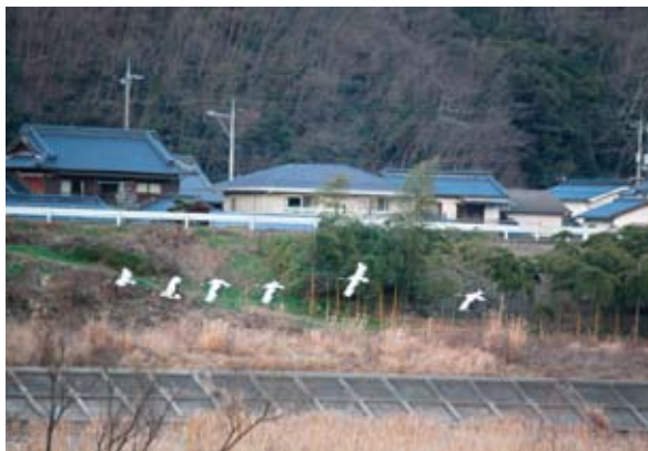
写真8. 6羽での帰巢 (2009.1.15)