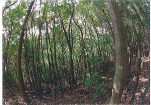
写真1. コントロール地の様子

本年度から始めた常緑広葉樹林の間伐であるが、間伐の強度の違いによって植物相の多様化や、残った樹木の成長が見られるかを今後も調査を実施し記録していくことで、最適な間伐の強度や森林の管理方法を確立していきたいと考えている。