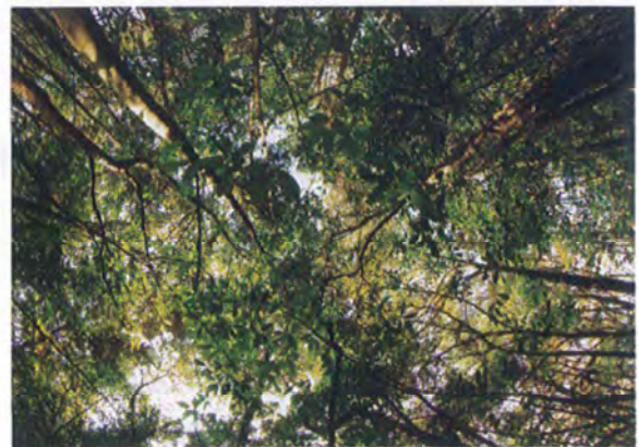
写真2. コントロール地の全天空写真