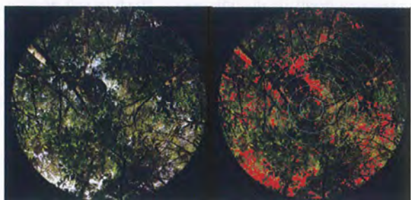
図1. コントロール地の開空度解析