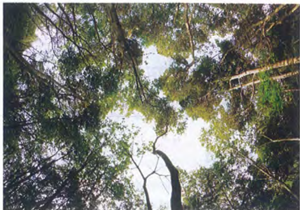
写真4. 間伐地の全天空写真