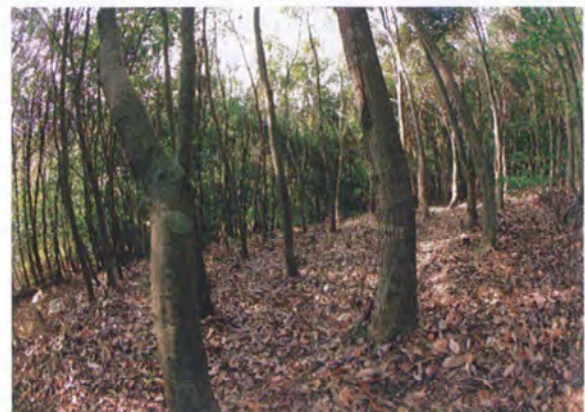
写真3. 間伐地の様子