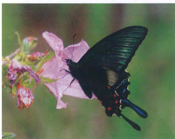
写真4. カラスアゲハ♂(2017年5月1日, モチツツジに訪花).