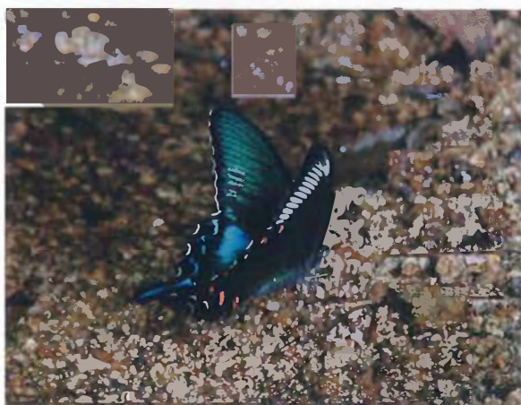
写真3. カラスアゲハ♂(2013年7月14日, 吸水).