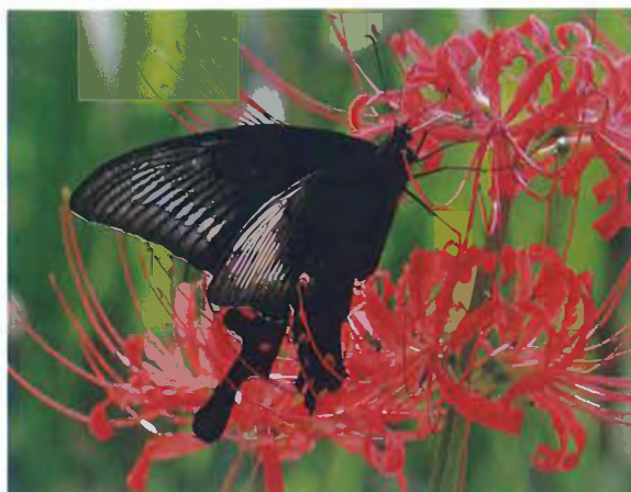
写真8. ミヤマカラスアゲハ♀(2011年9月25日, ヒガンバナに訪花).