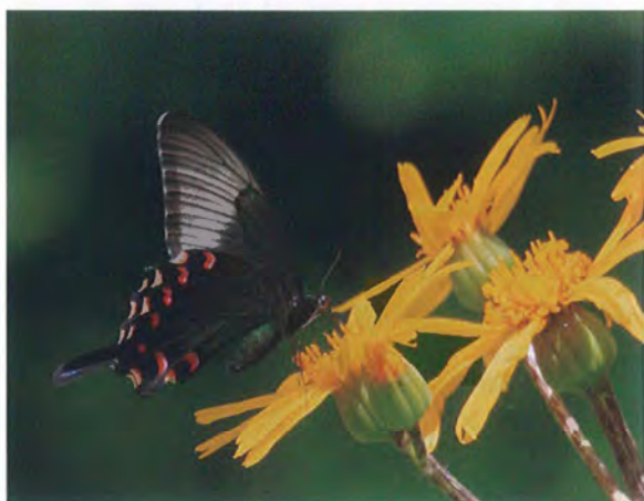
写真5. カラスアゲハ♀(2017年6月8日, 撮影者:N, ハンカイソウに訪花).