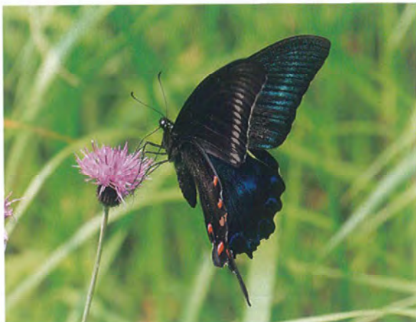
写真17. ミヤマカラスアゲハ♂(2019年6月19日, ノアザミに訪花).