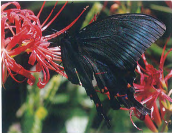
写真13. ミヤマカラスアゲハ♀(2015年10月2日, 撮影者:N, ヒガンバナに訪花).