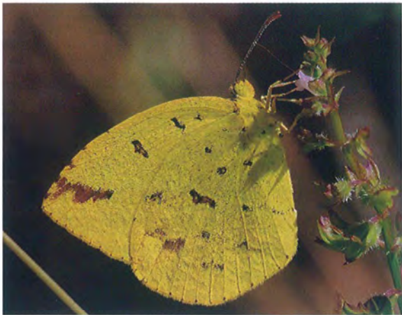
写真19. キタキチョウ(2018年10月8日, 撮影者:G, イヌコウジュに訪花).