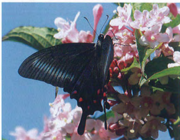
写真9. ミヤマカラスアゲハ♀(2012年5月6日, 撮影者:N, タニウツギに訪花).