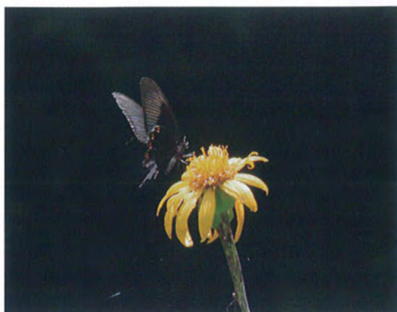
写真2. カラスアゲハ♂(2012年6月22日, 撮影者:N, ハンカイソウに訪花).