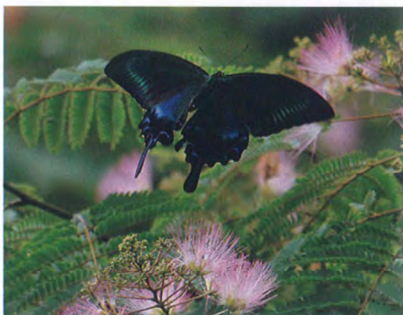
写真11. ミヤマカラスアゲハ♂(2013年6月30日, 撮影者:N, ネムノキに訪花).