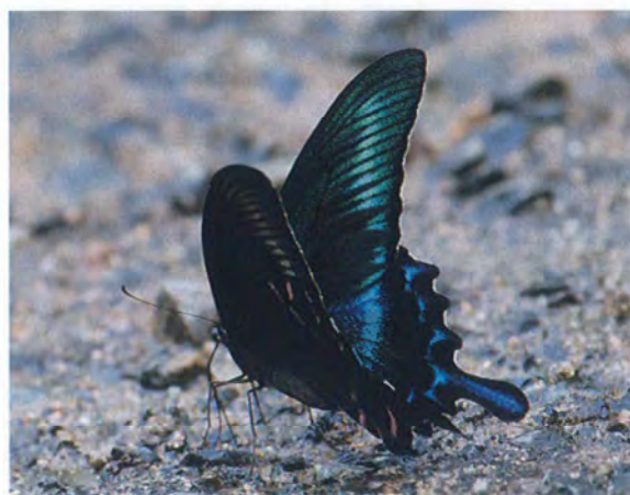
写真12. ミヤマカラスアゲハ♂(2014年8月23日, 撮影者:N, 吸水).