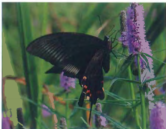
写真7. ミヤマカラスアゲハ♀(2011年9月6日, ミズトラノオに訪花).