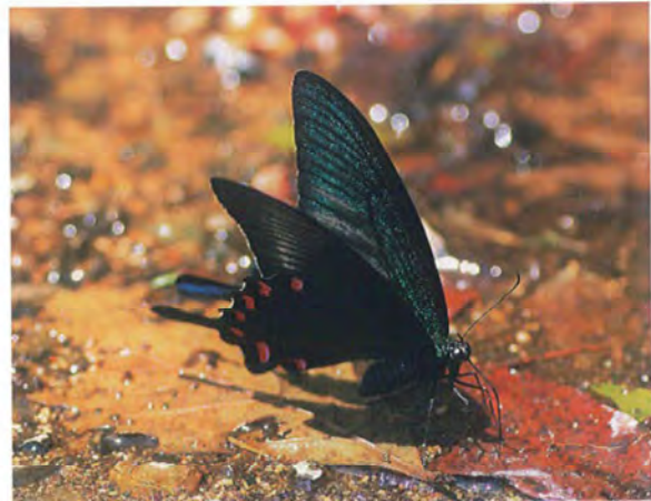
写真16. カラスアゲハ♂(2019年6月12日, 吸水).