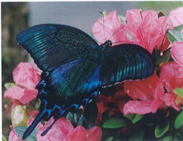
写真15. ミヤマカラスアゲハ♂(2017年6月19日, 撮影者:N, ヤマツツジに訪花).