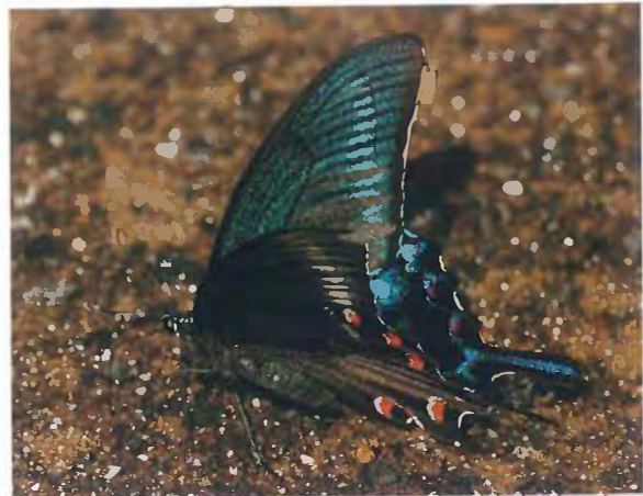
写真14. ミヤマカラスアゲハ♂(2016年6月23日, 撮影者:N, 吸水).