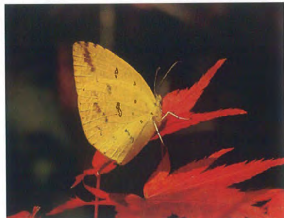
写真18. キタキチョウ(2016年11月18日).