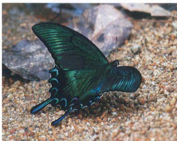
写真6. ミヤマカラスアゲハ♂(2011年6月18日, 吸水).