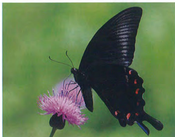
写真10. ミヤマカラスアゲハ♂(2013年6月16日, 撮影者:N, ノアザミに訪花).